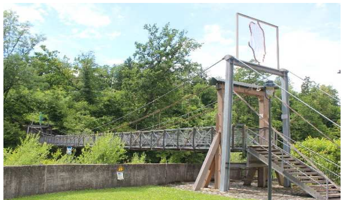
«Gwagglibrugg»